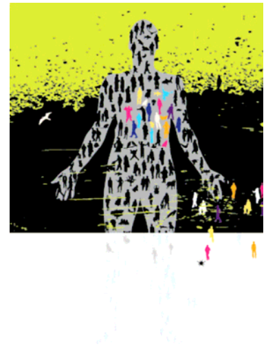
© by Headlines Theatre, „Us and Them“, 2010, created by Jegus Oprsal

Anmerkung: Weiterer Termin im Haus der Begegnung ist Mittwoch, der 21. März 2012, 19.30 Uhr. Die Aufführung kann zu einem Unkostenbeitrag von 200.- € auch gebucht werden. Kontakt: info@spectACT.at